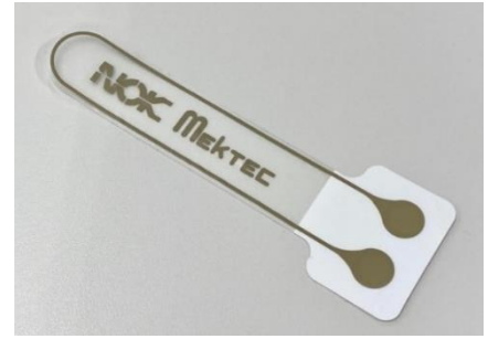
ストレッチャブル FPC (サンプル/全長 11cm)

ストレッチャブル FPC は、通常のポリイミドフィルムではなく、薄く通気性のある伸縮性シートと生体安全性を備えたメクテック独自の粘着剤を貼り合わせており、身体に安全にしなやかに密着します。脳波や心電などを取得する電極シートとして計測器に繋げて使用することが可能です。さらに、EMS 機器に繋ぐと、筋肉に電気刺激を効率よく与えることができます。