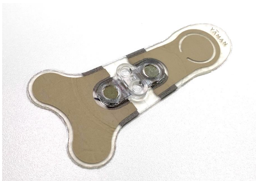
「ストレッチフィットシート」に採用された「ハイドロゲル付きストレッチャブル FPC」

「ハイドロゲル付きストレッチャブル FPC」は、全方位に伸縮して身体にフィットしながら効率よく EMS の電気信号を伝えるフレキシブルプリント基板(FPC)です。今回の採用は 2023 年 11 月に発売された目もと専用 EMS 美顔器「デザインリフト」に続いて 2 回目となり、前回同様メクテックの牛久事業場（茨城県牛久市）にて生産いたします。メクテックでは、引き続き、高品質な製品を安定して供給してまいります。